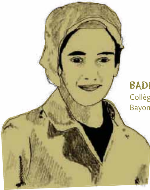
BADR, 4 e Collège Marracq Bayonne

« LE POSITIF, C'EST QU'ON COMMENCE PLUS TÔT À CONNAÎTRE LES MÉTIERS »