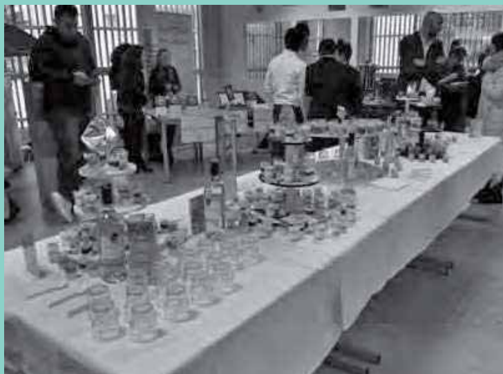
Les élèves lors de la réception organisée pour le forum professionnel Eidos, au collège Clermont.

14 heures : les cuisiniers nous rejoignent et nous lançons la mise en place. Quel plaisir de travailler avec eux ! Nous sommes fiers de partager ce temps et d'ouvrir notre atelier à des professionnels. Nous restons concentrés et attentifs malgré le stress qui nous gagne parfois. Nous devons absolument réussir nos préparations. La présence rassurante des cuisiniers, leur aide et leurs conseils nous guident et nous permettent d'avancer en gérant le temps.